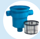
Filter mit Laubsammelkorb